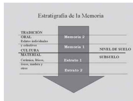
Foto 2: Diagrama que muestra la metodología utilizada en el taller, se reconstruye la historia local con la lógica del trabajo arqueológico, levantando y sistematizando diversas capas de memoria colectiva y cultura material.

La habilitación de la Sala Multimedia de Educación Patrimonial y la creación del sitio web si bien no soluciona completamente el problema de democratizar el acceso a los recursos patrimoniales y su esperada puesta en valor, contribuye a mejorar nuestro trabajo en Educación Patrimonial, permitiendo tanto