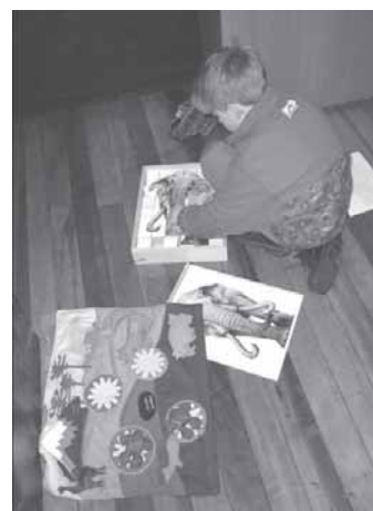
Foto 9: La idea de este proyecto es mostrar la prehistoria de la zona centro sur desde una perspectiva global, en la que niños y adultos interactúen con la museografía a través de juegos, paisaje sonoro y textos-guías

Concurso de Pintura: Una vez realizado el recorrido por parte de los alumnos, se les invita a participar en un concurso de pintura en el que puedan plasmar sus impresiones sobre la prehistoria regional, a partir de lo visto y experimentado en la muestra.