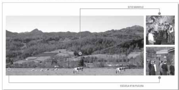
Foto 3: Ubicación del sitio Alero Marifilo-1 en la comuna de Panguipulli, Prov. de Valdivia, donde se realizó un taller de educación en la propia excavación.

Sitio Alero Marifilo-1 Comunidad de Pucura, Comuna de Panguipulli, X Región